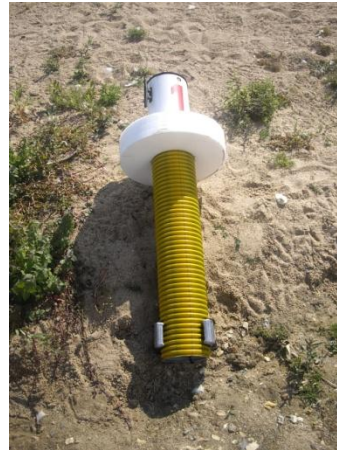
Minta bója gyermekeknek

A rajt intervallumot a szervezők határozzák meg.